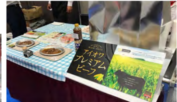
ブラックアンガスビーフ登場。特にヒレは美味。（アクト畜肉）