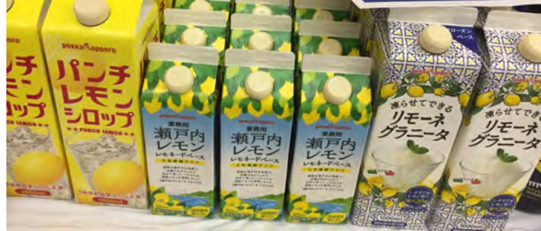
需要が高まるレモンを使ったドリンクベース商品各種。（ポッカサッポロ）