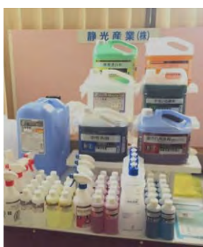
厨房の必須アイテム洗剤各種。（静光産業）