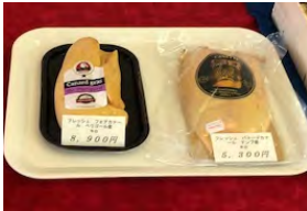
フレッシュオアグラ（アルカン）