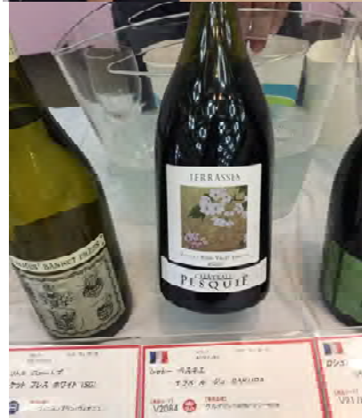
まずはジャケ買いで選びたくなるワイン（飯田）