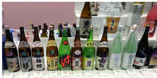
ずらりと並ぶ銘酒の数々。（アクト酒販）