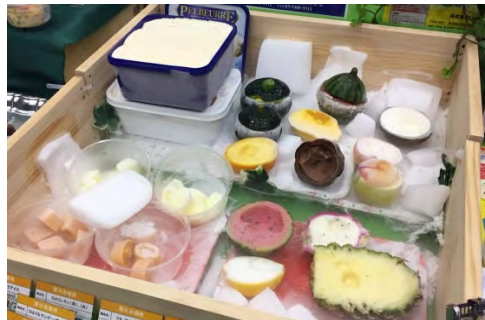
お皿に盛るだけで豪華なデザートに。カカオなど新商品も登場（Lisse）

高松提案会 2018年5月30日（水） サポートホール高松 ご来場者数264名（167組）