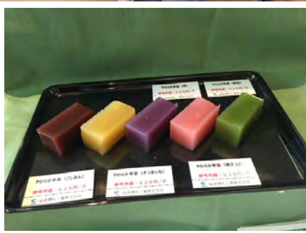
色とりどりの「やわらか羊羹」 左からこしあん、さつまいも、紫さつま、梅、抹茶味。（仙波糖化工業）