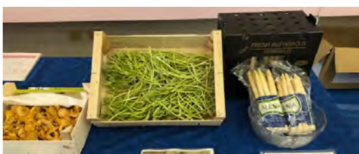
2～3週間しか収穫時期のないアスパラソバージュや春が旬のホワイトアスパラなど生鮮野菜がお目見え。（アルカン、マツヤ）